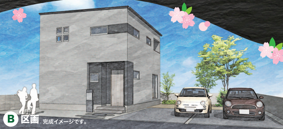
B 区画 完成イメージです。